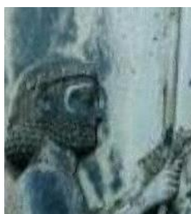
(ج) روش ارائه شده در [۱۰]